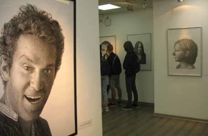
Предраг Букић: Портрети, туш на папиру, изложба цртежа, Срећна галерија, 5. мај