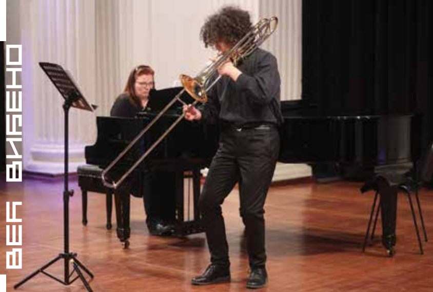
Концерт студената катедре за дувачке инструменте, Музички програм, 21. април Ђ. Пучини: Боеми, опера, Театар СКЦ, 29. април