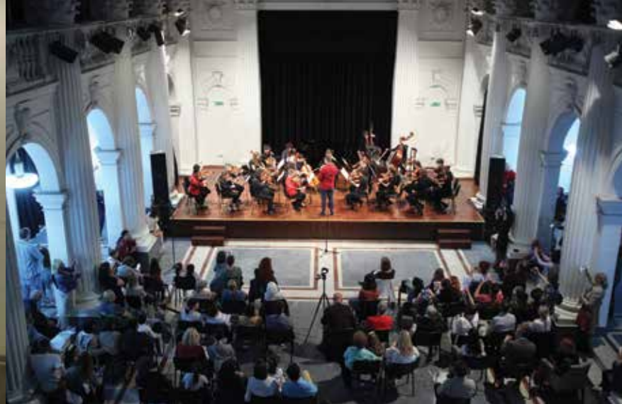
Концерт ученика МШ „Јосип Славенски“, Музички програм, 10. мај Циклус представљања факултета, Архитектонски факултет, Форум ++, 12. мај